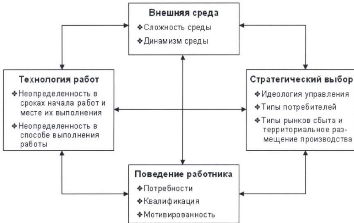
Рис. 1. Ситуационные факторы, оказывающие влияние на выбор организационной структуры управления предприятием