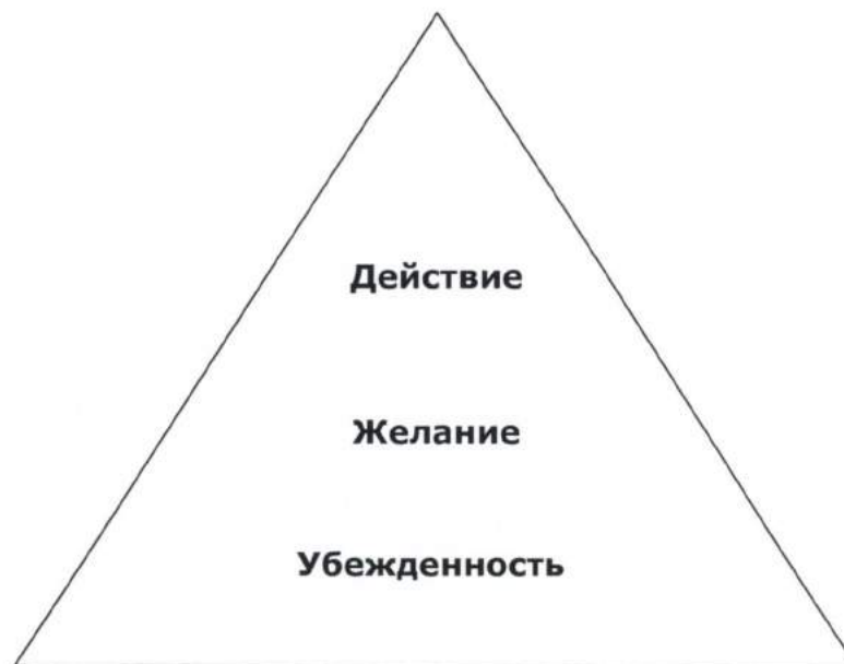
Рисунок 2. Пирамида коммуникационных целей